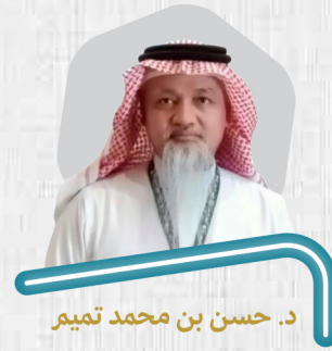
د. حسن بن محمد تميم