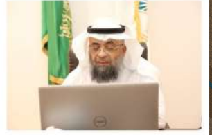
مسابقة سنن الأثرية مكة المكرمة

مشاركة الجهات الحكومية العاملة في خدمة ضيوف الرحمن "أجياد" تنظم ورشة عمل لمتابعة السلوكيات الخاطئة لبعض الحجاج والمحضرين