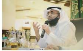
مسابقة سنن الأثرية الرياض

كزت وزارة الموارد البشرية والتنمية الاجتماعية جمعية الدعوة والإرشاد وتوعية الجاليات بجديد في فئة المعرفة برفع تكافؤ، لحصولها على المركز التاسع بالمملكة في مجال التطوع تكفيراً لجهودها في تحقيق مستهدفات التطوع من خلال تهيئة حساب الجمعية على منصة العمل التطوعي وفراج الفرص التطوعية.